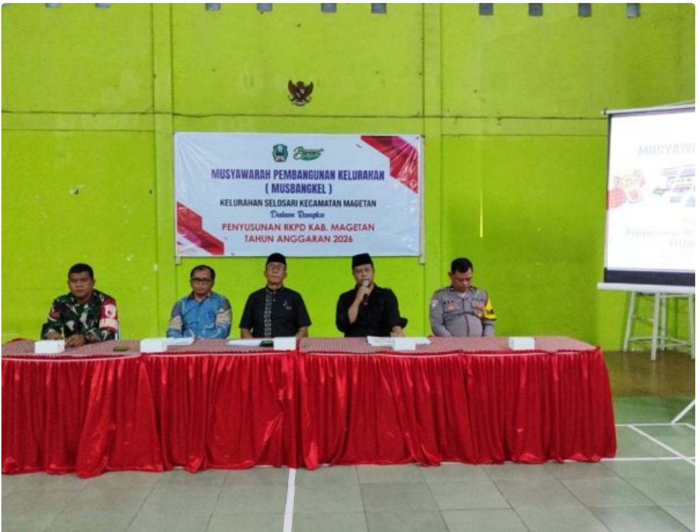
Babinsa Koramil 0804/01 Magetan Hadiri Musyawarah Pembangunan Kelurahan (MUSBANGKEL)

Magetan. - Babinsa kelurahan Selosari Koramil Tipe B 0804/01 Magetan jajaran