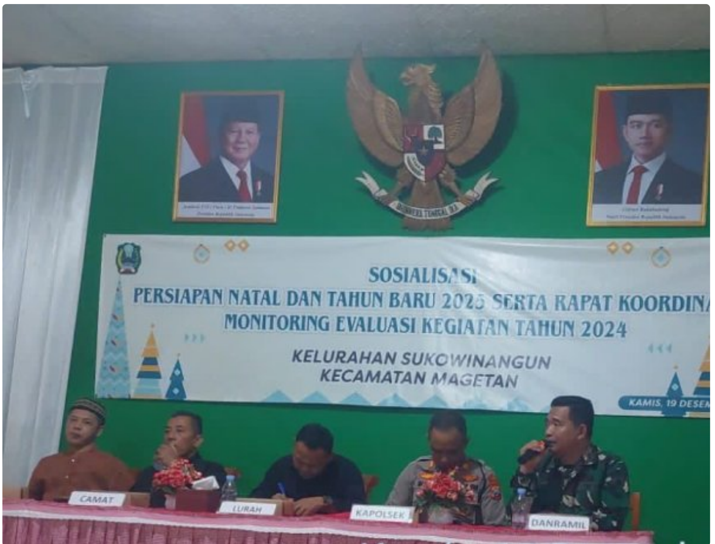
Danramil 0804/01 Magetan Bersama Forkopimca Hadiri Sosialisasi dan Persiapan Natal dan Tahun Baru 2025

Magetan. - Komandan Koramil Tipe B 0804/01 Magetan jajaran Kodim