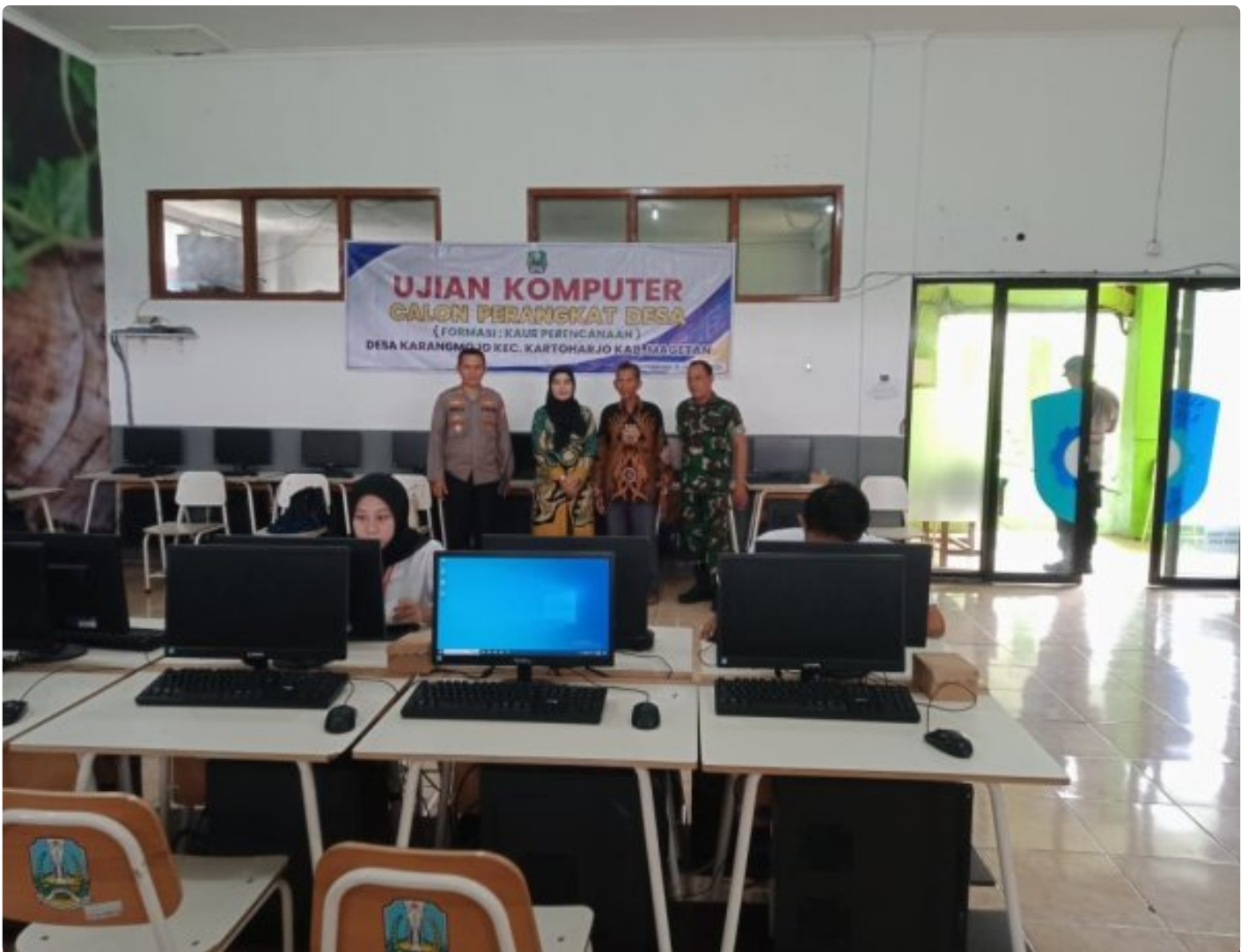
Danramil 0804/08 Barat Hadiri Penjaringan Ujian Praktek Komputer Calon Perangkat Desa Karangmojo

Magetan. – Komandan Koramil (Danramil) Tipe B 0804/08 Barat Kapten Inf