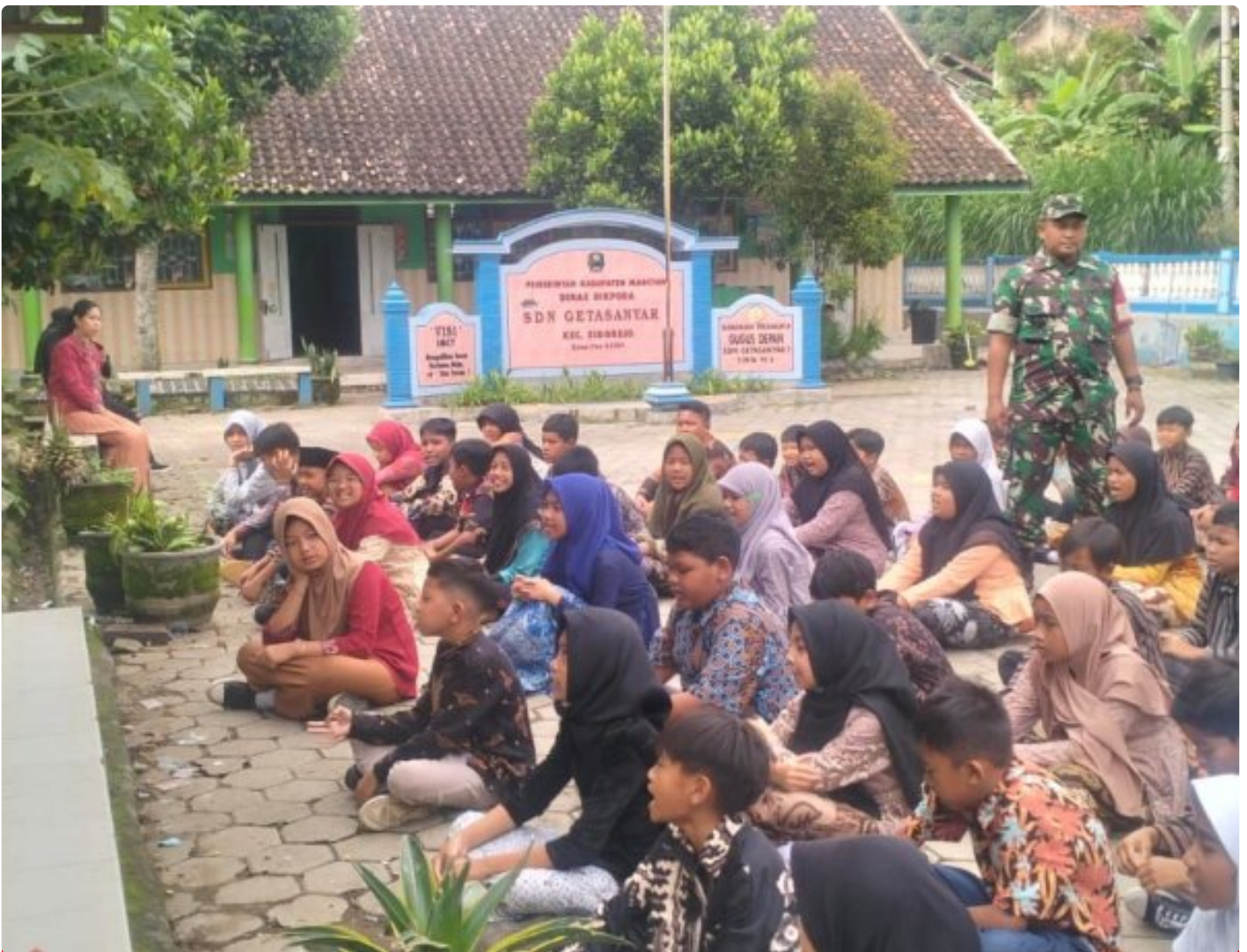
Kedisiplinan Kunci Kesuksesan, Bati Komsos Posramil Sidorejo Melatih PBB dan WASBANG Siswa SDN 1 Getasanyar