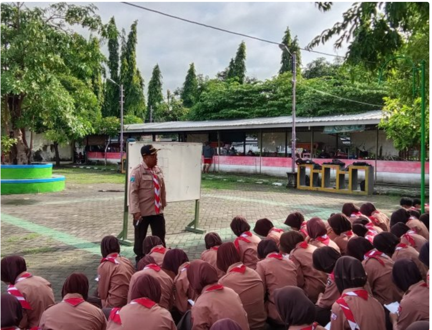
Pramuka Saka Wira Kartika Gelar Kegiatan Mengesan Jejak Untuk Mengasah Keterampilan Anggota

Magetan. Pramuka Saka Wira Kartika Pangkalan Slamet Riyadi Gudup 07.59-